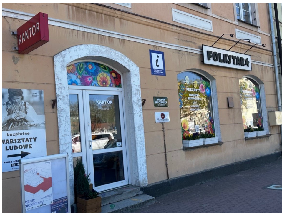
Witryna Muzeum Wycinanek w Łowiczu wraz ze sklepem rękodziela „Folkstar” – bezpośrednie sąsiedztwo autentycznego dziedzictwa i komercyjnego pamiątkarstwa. Łowicz, fot. M. Jankowska.

Modelowym przykładem jest łowicki przemysł pamiątkarski. Wzory wycinanki i haftu pojawiają się dziś na gadżetach, ubraniach, krawatach, opakowaniach produktów spożywczych, a nawet na tablicach rejestracyjnych, drogowskazach i pojazdach komunikacji miejskiej. Wytwórców i pośredników identyfikują marki takie jak „Folkstar” czy „Pasterka Barbara”. Platformami sprzedaży są Łowicki Jarmark, Spotkania „O Łowicki Pasiak” (od 2002 r.), Biesiady w Maurzycach i inscenizowane „Wesele Łowickie”, a wizytówką regionu w skali międzynarodowej pozostają obchody Bożego Ciała.