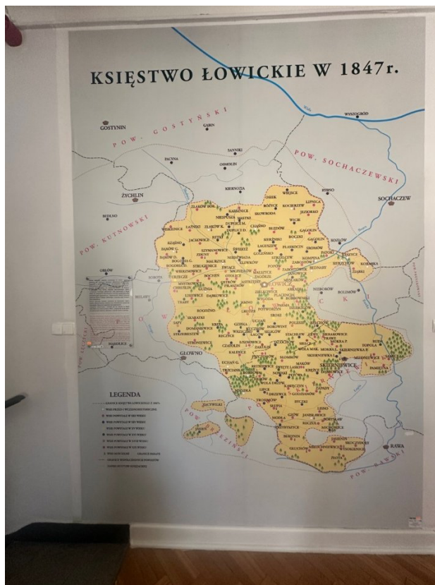
Wielkoformatowa mapa „Księstwo Łowickie w 1847 r.” – historyczny zasięg dawnego Księstwa z gęstą siecią wsi księżackich, z których wywodzi się tradycja wycinanki i haftu. Muzeum w Łowiczu, fot. M. Jankowska.

Grudzińska przybrała tytuł księżnej łowickiej ; wówczas po raz pierwszy w dokumentach pojawiły się nazwy Księstwo Łowickie i Księżacy. Wcześniejsze niż na reszcie Kongresówki zniesienie pańszczyzny (1838) i uwłaszczenie sprawiły, że wsie łowickie szybko stały się zamożniejsze, co już w XIX wieku umożliwiło rozkwit unikatowej kultury ludowej i barwnego stroju.