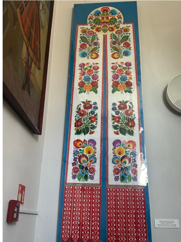
Największa łowicka „tasiemka”, wykonana zbiorowo przez sześć wycinankarek podczas XV Biesiady Łowickiej w Maurzycach (2014) – przykład twórczości zespołowej wymagającej koordynacji motywów i proporcji. Muzeum w Łowiczu, fot. M. Jankowska.

Szczególną manifestacją wspólnoty pozostaje doroczna procesja Bożego Ciała w Łowiczu, podczas której parafianie w pasiastych strojach przygotowują wspólnie ołtarze, a fragmenty Ewangelii odczytuje się w czterech językach ze względu na zagranicznych gości.