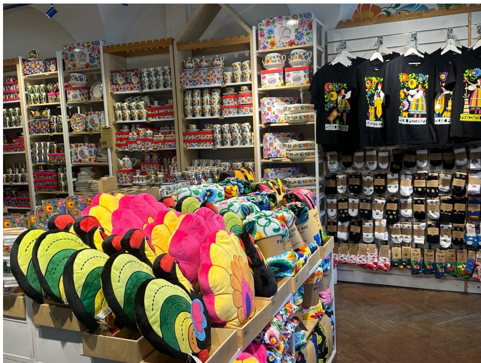
Tekstylne ozdoby i ceramika z motywami wycinanki łowickiej w sklepie pamiątkarskim – każdy „kwiatek” przeniesiony z papieru na masowo produkowany gadżet. Łowicz, fot. M. Jankowska.

Ta globalna kariera – od Grand Prix w Paryżu (1925) i ekspozycji na EXPO po ogon samolotu British Airways – nie jest tylko ciekawostką rynkową. Im dalej wzór podróżuje od miejsca pochodzenia, tym trudniej wspólnocie kontrolować jego użycie i tym pilniejsze staje się pytanie o instrumenty ochrony.