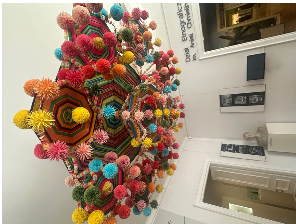
Monumentalny pająk łowicki pod sufitem sali wystawienniczej – słomiano-bibułowa ozdoba obrzędowa, której wykonanie tradycyjnie było pracą zbiorową, symbolizująca dobrobyt domu. Muzeum w Łowiczu, fot.M. Jankowska.