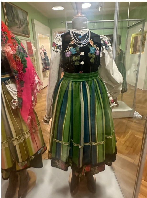
Kobięcy strój łowicki w wariacie letnim – czarny aksamitny gorset pokryty wielobarwnym haftem płaskim oraz welniak w zielonym pasiaku; klasyczny haft łowicki zdobi głównie strój kobiecy. Muzeum w Łowiczu