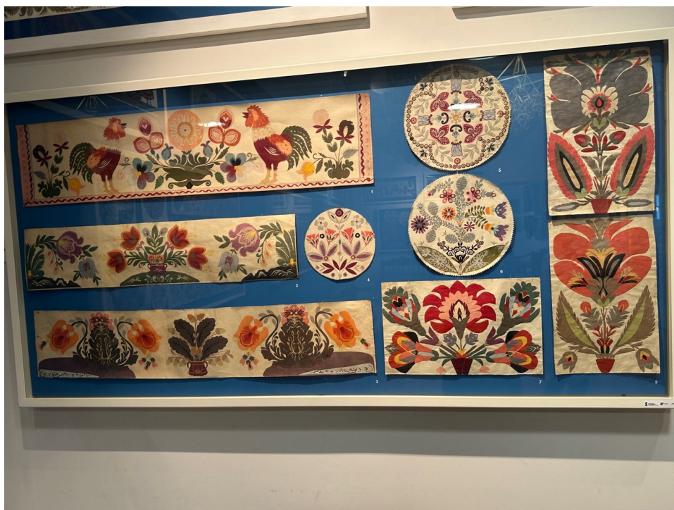
Gablota z klasycznymi typami wycinanki łowickiej – kodrami, gwiozdami i kompozycjami roślinnymi – pozwalająca prześledzić ewolucję wzoru od połowy XIX wieku po I połowę XX wieku. Muzeum w Łowiczu, fot. M. Jankowska.

Klasyczna wycinanka łowicka występuje w trzech typach tematycznych: najstarszym obrazkowym (sceny z życia wsi), roślinnym (symetryczne kompozycje stylizowanych kwiatów, często z ptakami) oraz najnowszym realistycznym (bukiety). Pod względem formy dzieli się zaś na trzy rodzaje. Gwiozdy – okrągłe kompozycje o symetrii promienistej – umieszczano na belkach sufitu. Kodry – poziome, prostokątne pasy – przedstawiały sceny weselne, obrzędowe i prace polowe (od lat 30. wykonywano też wielowarstwowe „kodry dęte”). Tasiemki – pionowe, bliźniacze pasy zwieńczone rozetą i wykończone frędzlami – wieszano na ścianach między obrazami. W latach 30. Franciszka Burzyńska z Błędowa zapoczątkowała wycinankę ażurową o układzie kół współśrodkowych, wielobarwną dzięki nakładaniu papieru na papier.