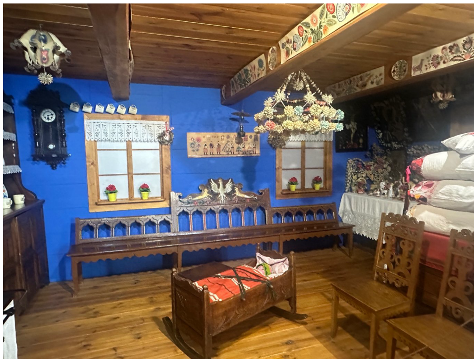
Zrekonstruowana świąteczna („biała”) izba chałupy łowickiej – na intensywnie niebieskich ścianach i belkach sufitu papierowe wycinanki: gwiazdy, kodry i tasiemki, a pod sufitem słomiany pająk. Muzeum w Łowiczu, fot. M. Jankowska.

Choć sama wycinanka i sam haft są przedmiotami materialnymi, to umiejętność ich wykonania – a zwłaszcza zdolność komponowania kanonicznych motywów bez gotowego szablonu – stanowi przejaw niematerialnego dziedzictwa kulturowego, ściśle związanego z tożsamością mieszkanek wsi łowickich, czyli Księżaczek . Twórczyni układa rozmieszczenie kwiatów, ich liczbę i proporcje w pamięci, opierając się na wyczuciu symetrii – podobnie jak koronczarka w Koniakowie czy hafciarka na Kaszubach.