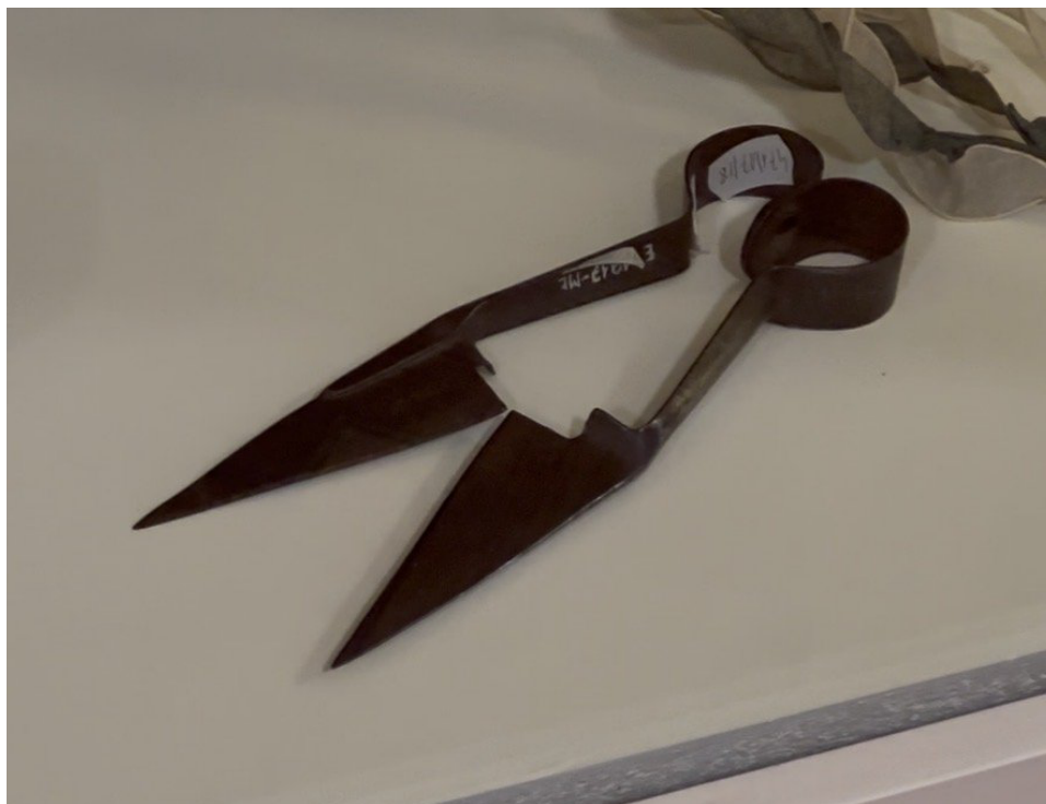
Tradycyjne nożyce do strzyżenia owiec – paradoksalne narzędzie łowickiego wycinankarstwa, którym wykrawa się filigranowe, ząbkowane ornamenty z wielokrotnie złożonego papieru glansowanego. Muzeum w Łowiczu, fot. M. Jankowska.

Haft przeszedł cztery etapy. „ Szycie polskie ” (łańcuszkowe) – subtelne, linearne, w którym nad barwą dominował rysunek ornamentu – Józef Grabowski uznawał za „najpełniejsze wyrażenie lokalnej sztuki ludowej”. „ Szycie ruskie ” (krzyżykowe) wprowadziło intensywną paletę i motywy zaczerpnięte z gotowych wzorów „książeczkowych”. Haft płaski pokrył duże połacie stroju bujnymi, tonowanymi bukietami, a wyszycia koralikowe dodały blasku. Odrębną odmianą jest haft biały , płaski, zdobiący przody męskich koszul zwanych „krawatami”. Klasyczny haft pokrywa głównie strój kobiety: czarne aksamitne gorsety, wełniaki, zapaski oraz mankiety i przyramki koszul.